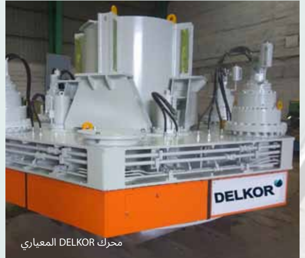
محرك DELKOR المعياري