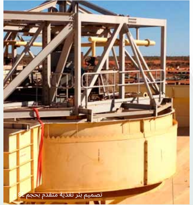
تصميم بئر تغذية متقدم بحجم ٤٤ م