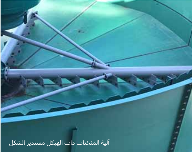
آلية المثخّات ذات الهيكل مستدير الشكل