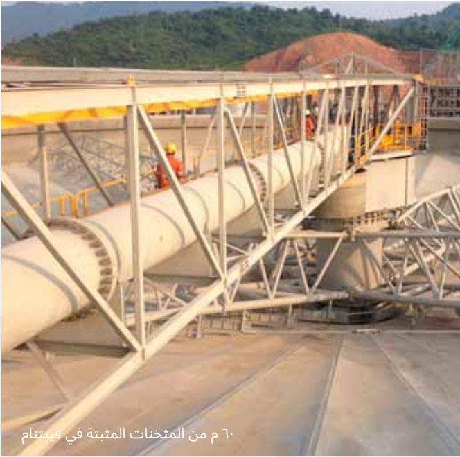
٦٠ م من المثخّات المثبتة في فينتام